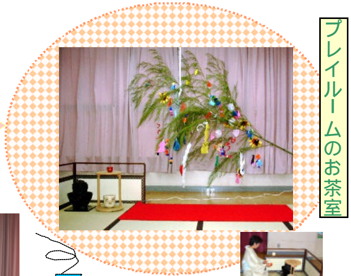
プレイルームのお茶室