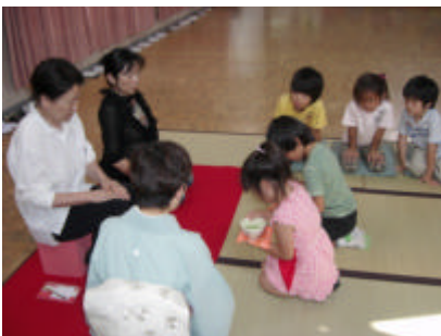
園長先生たちにお茶どうぞ！