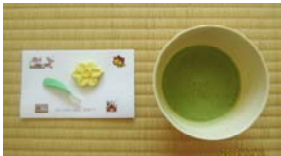
“水仙の花” “水仙の葉”