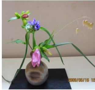
・ほたるぶくろ・小判草・むらさきつゆくさ・紫露草