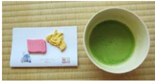
かぶと 兜 よろい 鎧