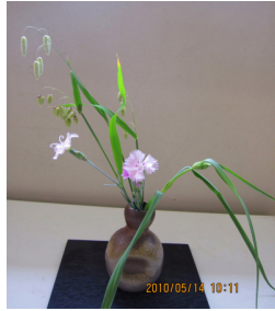
こばんそう ・ なでしこ ・ むらさきつゆくき 小判草 ・ 撫子 ・ 紫露草