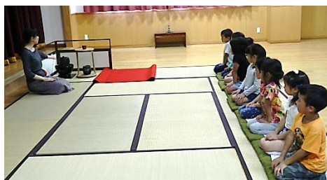
前回教わったお道具の復習です