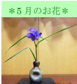
・ムラサキツユクサ

先月に引き続いて、2回目のおけいこをしました。 前回教えていただいたお道具を復習し、今回はお茶のいただき方を中心に教えてもらいました。 お席入り(お茶席に座ること)から、お座布団(お席がわかりやすいように使用しています)に座る座り方、 お菓子・お茶のいただき方を、それぞれ順を追って手本を見ながら挑戦しました。 緊張したり、ちょっぴり難しいなあ…と、子どもたちは、様々な表情をしていました。