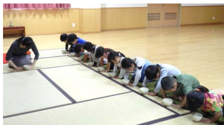
お茶ちょうだいします