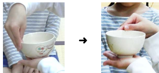
お茶をいただく時、向こうから手前に 2回まわします (飲み終わったあとは、逆になります)