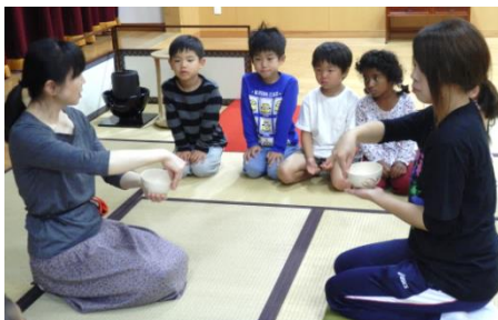
先生のお手本をしっかり見て おぼえましょう！