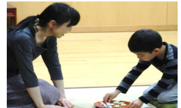
お菓子は、左手をそえて 遠い方(上)から取ります