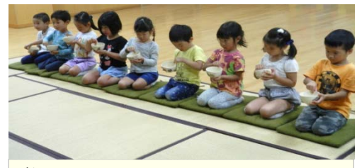
飲み終わったら、口をつけたところを 親指と人差し指ではさんでふきます