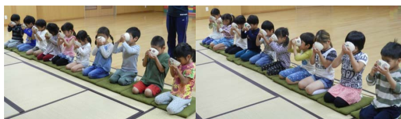
おいしく飲めるかな…？ ごっくん…ごっくん…

6月のおけいこは、 4月・5月のおさらいで、 お菓子とお茶のいただき方になります。