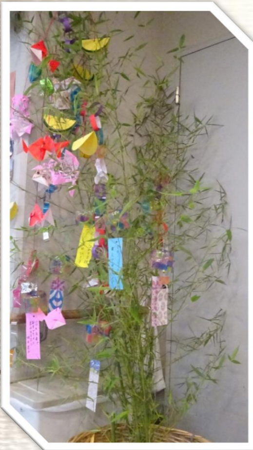
デイルームの入り口付近に立派な笹☆ 願いがしっかりと届きますように！

飛鳥ともしび苑デイサービスでは、ご利用様が書かれた短冊や、職員と一緒に作成した飾りものを心を込めて笹に結び付けました！皆様の願いが叶いますように(*^-^*)☆